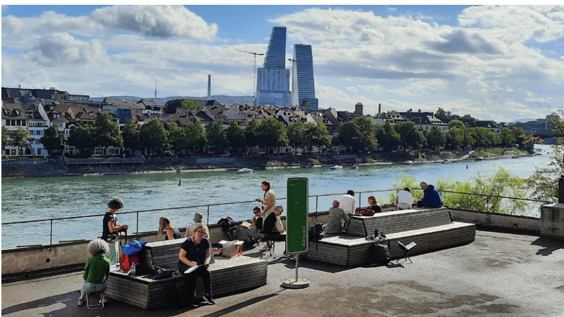
9.9.2022 / Workshop von Olivia Aloisi beim Rheinsprung

Der Sketchcrawl am Samstagmittag zentral am Rhein rund um die Kaserne war öffentlich zugänglich samt Skizzenausstellung, Auktion und Apéro.