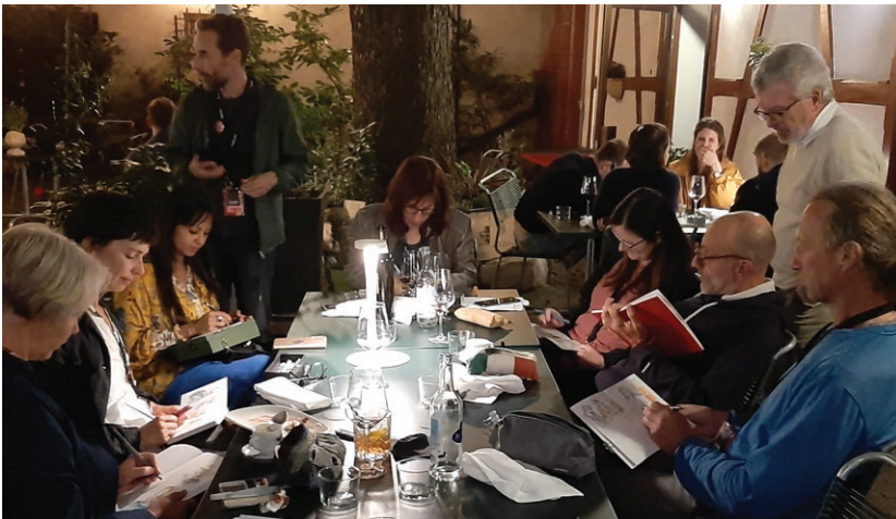
9.9.2022 / Abendessen der WorkshopleiterInnen mit OK im Restaurant Rebhaus

Die LeiterInnen der Workshops haben es sehr geschätzt, bei einem gemeinsamen Abendessen und beim Drink & Draw einander kennen zu lernen, miteinander zu zeichnen, und gegenseitig die Skizzen zu sehen.